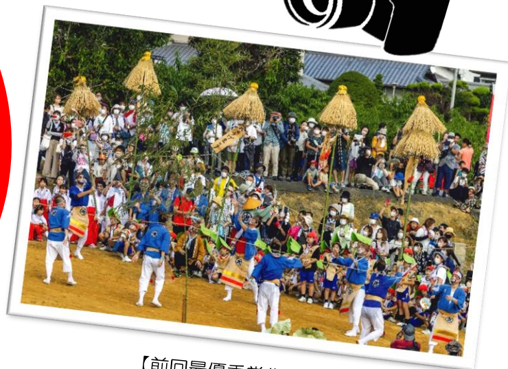
【前回最優秀賞作品】